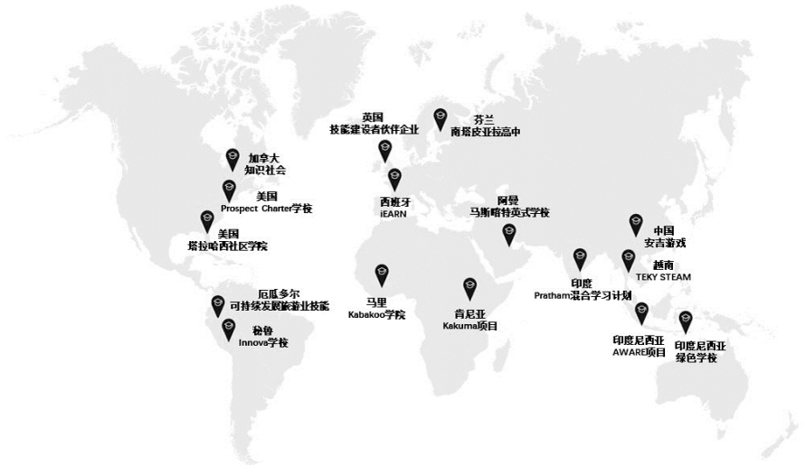
图 2 未来学校案例分布